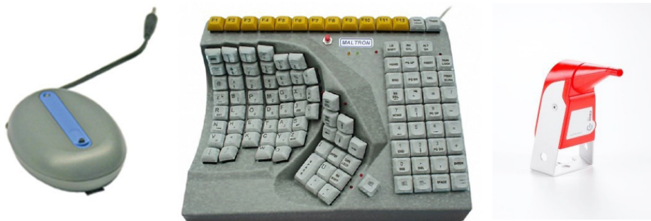
Rys. 2. Przykładowe urządzenia wspomagające pracę z komputerem

Kompleksową informację w zakresie dostosowania środowiska pracy można znaleźć m.in. w następujących instytucjach: