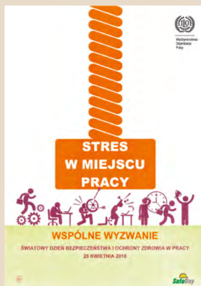
Fot. Plakat MOP na 2016 rok (zarazem okładka raportu)

Plakat Dnia 28 kwietnia (fot.) oraz fragmenty Raportu MOP zostały przetłumaczone przez CIOP-PIB na język polski i mogą być wykorzystywane w krajowej kampanii.